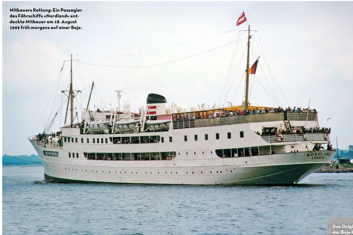
Mitbauers Rettung: Ein Passagier des Fährschiffs «Nordland» entdeckte Mitbauer am 18. August 1969 früh morgens auf einer Boje.

täglich sechs bis neun Stunden trainiert hat, darf lebenslang keine Sportstätte mehr betreten. Er bedingt sich einen letzten Wettkampf gegen die DDR-Schwimmelite aus, der ihm gewährt wird. Und besiegt alle. Am Bannstrahl gegen ihn ändert das nichts. «Sie nahmen mir alles. Oder fast alles. Denn das Wichtigste, was man hat, trägt man im Kopf.»